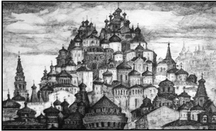
Fig. 1.7. E. Maleșevschi. Turle . 1900, hârtie, tuș, peniță, 42,7 x 49,5 cm.

Perioada „realismul socialist” a modificat creația plasticienilor moldoveni în perioada sovietică, a impus rigori severe, ideologizate, iar peisajul a devenit un instrument de propagare a „vieții fericite” a constructorilor socialismului .