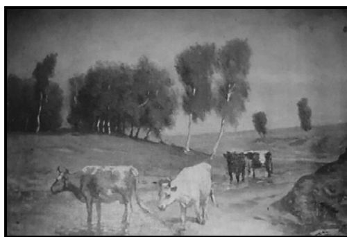
Fig. 1.1. V. Ocușco, Cocioabă, 1881, u/p, (cu semnătura autorului), ANRM, fond personal 2116