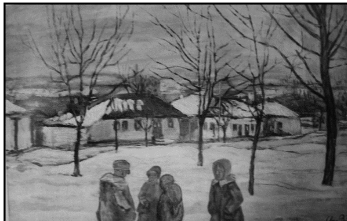
Fig. 1.8. Auguste Baillayre. Mahala din Chișinău. Iarna , 1942, u/p, 66x82 cm.

Perioada „realismul socialist” a modificat creația plasticienilor moldoveni în perioada sovietică, a impus rigori severe, ideologizate, iar peisajul a devenit un instrument de propagare a „vieții fericite” a constructorilor socialismului .