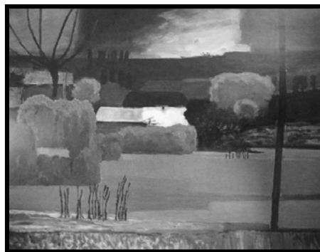
Fig. 1.3. Igor Vieru, Noapte de iulie. 1974, u/p, 161x209 cm. MNAM.