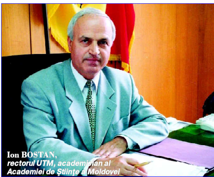
Ion BOSTAN, rectorul UTM, academician al Academiei de Științe a Moldovei

UTM se raliază la rigorile Procesului Bologna, care prevede sporirea calității studiilor și implicit recunoașterea diplomelor de absolvire în țările europene, înlesnind angajarea tinerilor specialiști atât pe piața muncii din RM, cât și pe cea europeană. Se intensifică mobilitatea studenților: tinerii au posibilitatea să învețe timp de 1-2 semestre în una din universitățile europene.