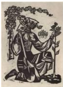
I. Vieru Înflorire (din ciclul Inima cântă ), 1964, linogravură

Tematica muncii și a „construcției viitorului” a fost explorată pe larg (și nu tot timpul reușit) de numeroși artiști plastici, printre care pot fi nominalizați I. Taburța – ciclul de linogravuri Moldova revoluționară (1968), L. Beleaev – Veșnică slavă eroilor Patriei (1965), V. Moțcaniuc – seria de portrete ale fruntașilor muncii, ș.a.