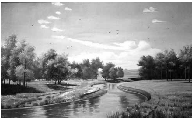
Fig. 22. Mihai Traci. Peisaj cu râu . Ulei pe pânză.

Pe lângă ocupația sa de bază – arhitectura, Mihai Traci avea o predilecție deosebită pentru pictură. A creat lucrări de un nivel foarte înalt, peisaje lirice cu diverse stări ale zilei și fenomene ale naturii, pe pânză și carton, în ulei și acuarelă, lucrări ce se află în colecții particulare: Peisaj de toamnă , Peisaj cu biserică , Peisaj cu râu (fig. 22) etc. În peisajele forestiere și