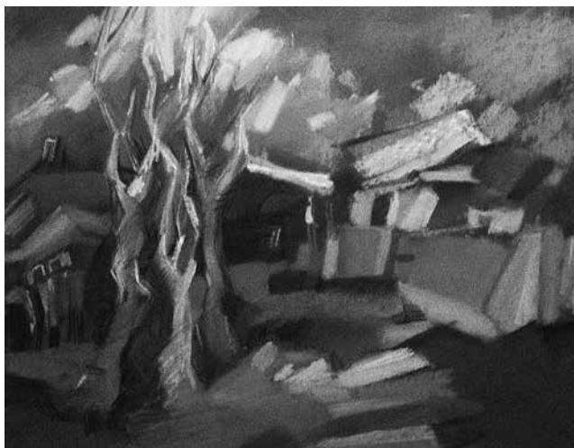
Fig. 3. Mariana Hadji-Bandalac. Peisaj . Pastel/carton.

umană, edificiile, dar și lumea vegetală sunt stilizate și armonizate în compozițiile proiectelor de curs.