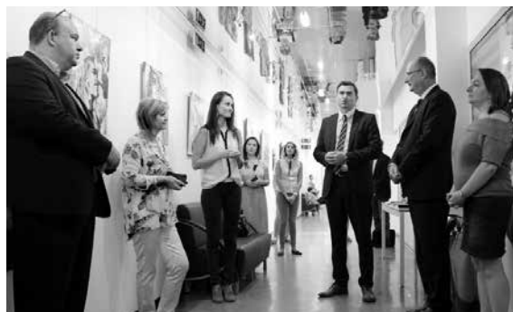
Fig. 12. Deschiderea expoziției personale a pictoriței Nicoleta Vacaru. Printre oaspeți, ambasadorul Franței în Republica Moldova, Excelența Sa, Domnul Pascal Vagogne.