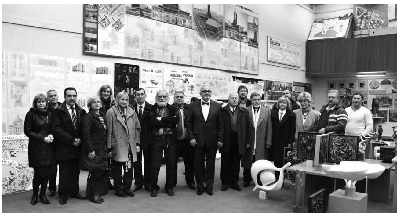
Fig. 10. Profesorii Catedrei de arhitectură la deschiderea expoziției din anul 2013.

cu studenții, care și peste ani comunică cu dascălul lor. Organizează și participă cu discipolii săi la diverse expoziții și proiecte, postează lucrările acestora pe pagina sa de internet, ele fiind vizualizate de mii de iubitori de artă.