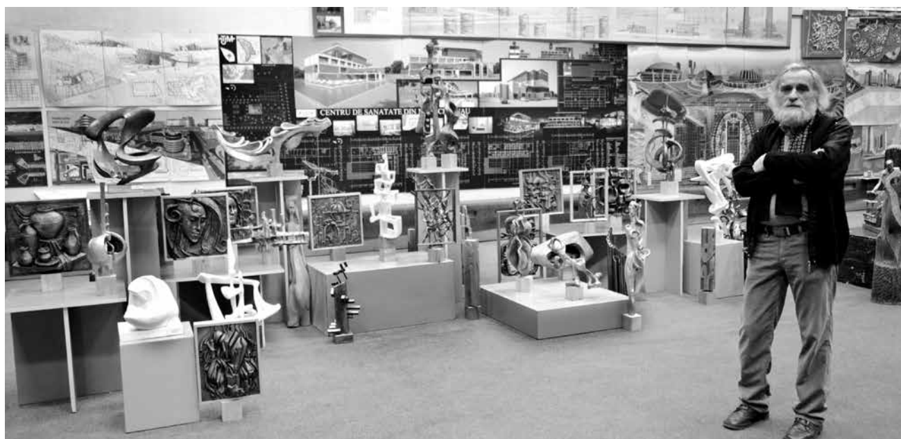
Fig. 9. Victor Drebot pe fundalul unei expoziții anuale.