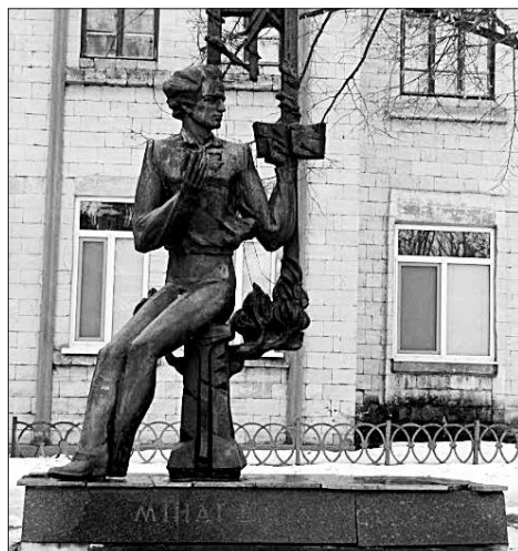
Fig. 6. Victor Drebota. Monumentul lui M. Eminescu. Bronz. 1992. Orașul Fălești.