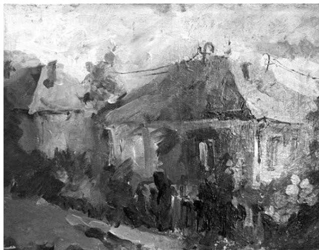
Fig. 4. Angela Munteanu. Peisaj rural . Ulei pe pânză.

Expoziția-Concurs „Salonul de primăvară”, Centrul Expozițional „C. Brâncuși”, Chișinău (2014); expoziția personală „Avant”, Centrul Expozițional ARTIUM (2014) etc. Lucrările sale cuprind teme diverse: peisaje arhitectonice, compoziții figurative și nefigurative, dar și multe portrete.