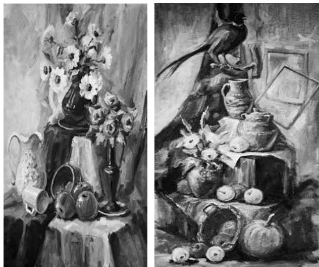
Fig. 19. Bujorean Radion, gr. ARH-132. Natură statică cu flori – 3. Ulei pe pânză. Fig. 20. Bujorean Radion, gr. ARH-132. Natură statică cu pasăre. Ulei pe pânză.

Studenții care studiază la Catedra de arhitectură sunt receptivi la experimente, iar explorarea materialelor și tehnicilor de lucru diverse este tema lor