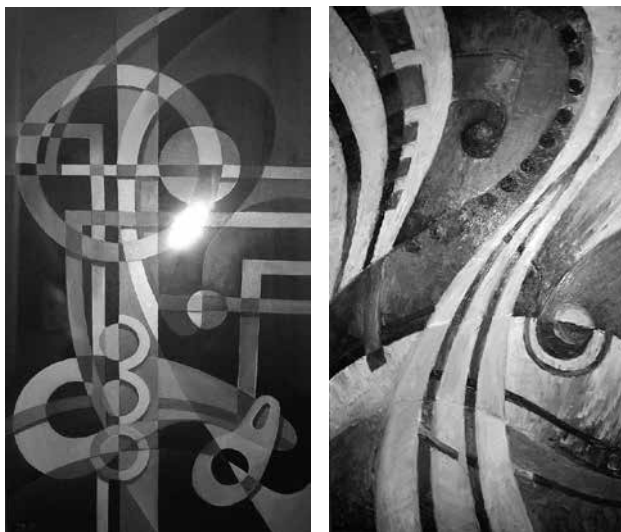
Fig. 23. Mihai Traci. Dinamica mișcării în spațiu . Ulei pe pânză.

arhitectonice, rustice și urbane, de vară sau toamnă, putem citi lumea lăuntrică a pictorului, romantic și iubitor de frumos și viață. Dacă de la natură a selectat forme figurative, de la arhitectură a cules imensul formelor profunde, labirintul gândului și plinătatea lucrării. Din aceste lucrări citim imaginația arhitecturală a plasticianului și arhitectului Mihai Traci: Dinamica mișcării în spațiu (fig. 23), Mișcare eternă , Labirint , Spațiul și timpul .