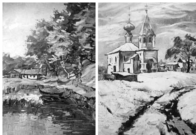
Fig. 1. E. Bognibov. Pe lacurile din Lituania . Ulei pe pânză. Fig. 2. E. Bognibov. Iarnă în Suzdal . 1987. Ulei pe pânză.

Pentru a face orele mai eficiente, profesorii de proiectare D. Andronovici și S. Tronciu elaborează indicații metodice, care vin în ajutor studenților, ele fiind completate cu desene grafice. Anturajul, figura