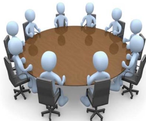
Fig. 1. Reengineering concept