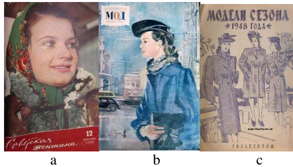
Figura 1. Reviste de modă ce datează cu perioada anilor 1945-1950: a – „Sovietscaya jeņșcina”; b – „Jurnal mod”; c – „Modeli sezona”

În revistele de modă ce datează cu perioada examinată, se propun rochii și paltoane de siluete variate, diverse croieli de mâneci și gulere, cât și modalități de prelucrare a diferitor repere vestimentare. Tendința pentru drapaje se păstrează pentru o perioadă mai îndelungată, atât la rochii, cât și la costume și paltoane. Tot pentru perioada luată în studiu sunt răspândite broderiile, care se propun pentru diverse tipuri de produse vestimentare atât pentru femei, cât și pentru copii. La multe modele de paltoane se propuneau manșete înalte. O gamă variată de modele se confecționau cu croială raglan (fig. 2 ) [1, 2,3].