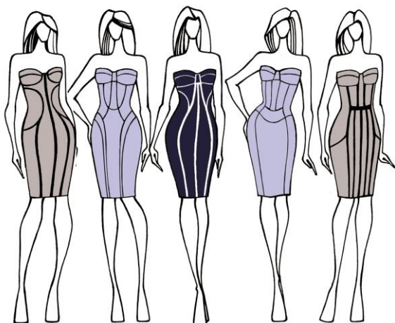
Figura 5. Diversificarea formei prin intermediul liniilor constructiv-decorative, accentuate prin elemente de garnisire.

O altă posibilitate de variație a modelului vestimentar, ar fi diversificarea compozițiilor create de liniile de divizare a suprafeței formei modelului. Deci, în cadrul unei colecții de modele, una și aceeași formă poate fi diversificată doar prin intermediul liniilor de divizare constructiv-decorative. Modalitatea de accentuare a liniilor de divizare în astfel de compoziții poate fi realizată prin utilizarea diferitor elemente de garnisire cum ar fi panglici, canturi, dantele etc. (fig.5) sau prin activizarea elementelor constitutive ale formei prin culori contrastante (fig.6).