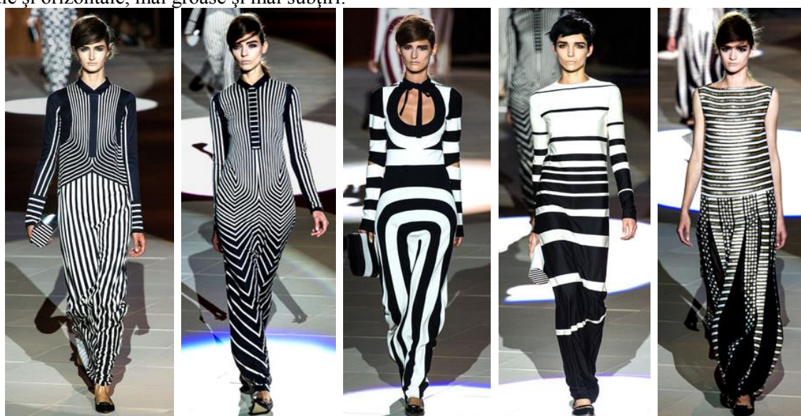
Figura 2. Modele din colecția Marc Jacobs, primăvară-vară 2013 [7]

Nici grafica liniară nu lipsește din colecțiile pentru sezonul de primăvară-vară 2013. Rochiile „creion” în dungi, propuse de Marc Jacobs (fig.2), foarte delicat subliniază siluetele manechinelor. Modelele propuse în această colecție se disting prin simplitatea formei, dar care captivează, anume prin jocul îmbinării de linii verticale și orizontale, mai groase și mai subțiri.