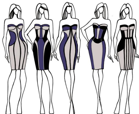
Figura 6. Diversificarea formei prin intermediul liniilor constructiv-decorative, activizate cromatic.

Soluționarea cromatică a modelului influențează modul de percepere a formei. Astăzi, tendințele modei se schimbă foarte rapid, însă cât de extravagante nu ar fi formele noilor modele, în primul rând se percepe culoarea produsului. În dependență de efectele și asocierile psihologice pe care le creează soluționarea cromatică a modelului vestimentar, se analizează și forma acestuia, care poate fi sesizată așa cum este ea în realitate sau perceptibil denaturată. Această capacitate a culorilor de a crea anumite efecte psihologice poate fi utilizată în organizarea compoziției costumului, în scopul înlăturării anumitor deficiențe ale figurii.