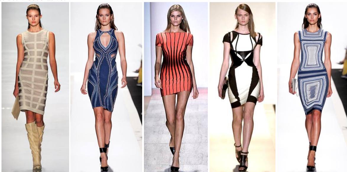
Figura 1. Modele din colecțiile Herve Leger [7]

Dacă ar fi să urmărim creațiile designerilor, pentru care linia este un mijloc esențial în organizarea compozițiilor vestimentare, ar putea fi remarcăți cei, care lucrează cu forme simple și plasează accentul pe soluționările constructiv-decorative ale modelelor. În acest context poate fi menționată creația lui Hervé Léger. Deși utilizează aceeași formă de bază – rochia de siluetă ajustată, – în fiecare colecție acesta ne prezintă noi posibilități de soluționare compozițională a plasticii liniare, unde linia joacă rolul primordial. Ținutele sunt diversificate atât prin cromatică și imprimeuri, cât și prin variația la infinit a liniilor constructiv-decorative.