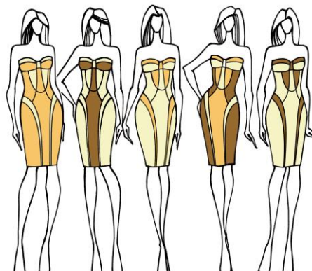
Figura 4. Diversificarea cromatică a modelelor.