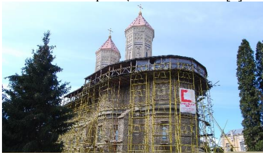
Fig. 3. Reabilitarea Mănăstirii „Sfinții Trei Ierarhi”, Iași

Reconstrucții și restaurări: Lucrările de restaurare au fost efectuate în anii 1882 – 1887, ceea ce ține de arhitectură și până spre 1898-pictură (pictura originală a fost refăcută complet, aducându-se elemente noi) și reamenajarea interiorului. Aceste lucrări de restaurare au fost efectuate sub conducerea arhitectului André Lecomte de Noüy. Iconostasul a fost schimbat în aceeași perioadă cu unul sculptat în marmură de Carrara și decorat cu mozaicuri și emailuri, iar sub comanda arhitectului francez turnul-clopotniță a fost demolat [7].