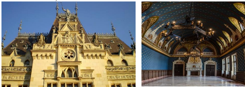
Fig. 5. Elemente restaurate

Reconstrucții și restaurări: Întregul proiect de reabilitare a Palatului Culturii din Iași [16] s-a desfășurat în intervalul octombrie 2007 – ianuarie 2016, cu o întrerupere de 3 ani (oct. 2011 – oct. 2014), perioadă în care lucrările deja executate în prima etapă a investiției au intrat în conservare. Peste 350 de specialiști au reabilitat zidurile, pictura interioară și exterioară, dar și mobile, cu o suprafață de 34.000 mp. Au fost salvate, pe cât s-a putut, și zidurile vechi găsite în fundația Palatului care pot fi observate prin podele de sticlă. Valoarea totală a investiției (cuprinde proiectarea și cele două etape ale execuției lucrărilor) este de 26.433.342 Euro, fără TVA.