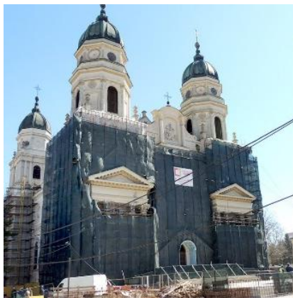
Fig. 6. Catedrala Mitropolitană a Moldovei și Bucovinei din Iași