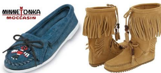
Figura 2. Mocasini din proiectul “Minnetonka Moccasin” [2,3].

sub denumirea “Gommini”, fiind destinați ocaziilor speciale și pentru odihnă (fig. 3). Astăzi cea mai mare colecție de mocasini cu crampe Tod’s aparține lui Bill Clinton [1].