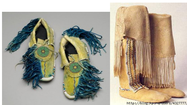
Figura 1. Modele de mocasini antici purtate de indieni

Încălțăminte triburilor de indieni era rezistentă, comodă și nu producea zgomot în timpul exploatării, fapt important pentru practicarea vânătorii. De obicei mocasini se confecționau din piele de căprioară, bizon sau elan. Indienii rar lăsau culoarea palidă a pielii pentru confecționarea încălțăminte – nuanța depindea de timp, metoda de afumare și tipul de lemn utilizat pentru aceasta. Bărbații zonelor sudice purtau mocasini cu franjuri, care se montau în cusătura posterioară a încălțăminte (fig.1). Se considera că aceste franjuri acoperă nu doar urmele fizice ale vânătorilor, dar și urmele sufletești ale purtătorului său [1].