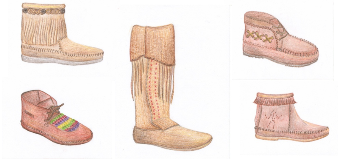
Figura 4. Modele propunere de mocasini cu diferită înălțime a carîmbilor

În ultimul timp se observă un interes sporit al populației, privind purtarea încălțăminte ce oreră confort sporit, spre exemplu sortimentul de încălțăminte mocasini, întîlnit frecvent în rîndurile celor tineri. În așa condiții producătorii autohtoni de încălțăminte ca: „Zorile”, „Cristina”, „Hîncu” se orientează iscusit spre cererea consumatorului și confecționează diferite modele de mocasini pentru bărbați, femei și copii. De aceea au fost elaborate modele de mocasini cu aspect folk – ghete și cizme (cu carîmbi peste maleolă și respectiv pînă sub genunchi) inspirate din diferite surse care pot fi propuse întreprinderilor autohtone pentru producție ( fig. 4).