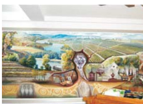
Fig.5 "Tăria viței de vie", pictură parietală, muzeul de vinuri și coniacuri "Kvint", or. Tiraspol, R.Moldova