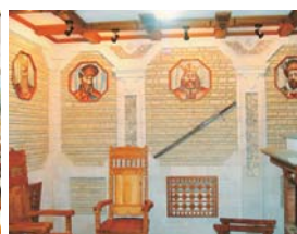
Fig.6 Sala Voievozilor, Școala de Arte și Meșteșuguri "Meșterul Manole", Chișinău