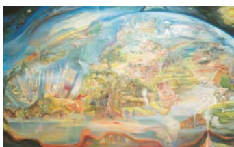
Fig.4 "Civilizație" din Sala Biosferei, Muzeul de Etnografie și Istorie Naturală, Chișinău

După absolvirea studiilor superioare la Institutul Industrial de Arte Plastice, în prezent Academia de Arte și design, or. Harkov, Ucraina (1967) se afirmă ca un bun monumentalist atât în țară cât și peste hotare (Rusia, Ucraina). Putem menționa câteva lucrări valoroase în pictura parietală precum "Civilizație" (Sala Biosferei a Muzeului de Etnografie și Istorie Națională, Chișinău)(Fig.4), pictura "Tăria viței de vie" (Tiraspol, Muzeul Fabricii de Vinuri și Coneacuri "Kvint") (Fig.5), mozaic bizantin "Sala Voievozilor" (Școala "Meșterul Manole", Chișinău) (Fig.6), mozaic bizantin "Sfânta Treime" (Frontonul bisericii Sf. Nicolaie, or. Basarabasca) (Fig.7)[2].