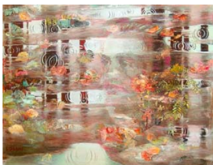
Fig.1 Picături nostalgice/ 90 x 70 pânză, ulei 2010

Activitatea sa creatoare nu poate să nu inspire și să nu producă admirație. Procesul de activitate a artistului I. Daghi debutează odată cu absolvirea Școlii de Arte Plastice din or. Chișinău (1960), în calitate de tânăr pedagog la Școala-internat N.1 din or. Râbnici, concomitent continuând să facă pictură de șevalet, ulterior participând la diverse expoziții personale și de grup, republicane și internaționale. Din acele timpuri datează primele lucrări din ciclul "Eminesciana plastică", care sunt de o mare rezonanță internă și internațională, câteva fiind prezentate în Fig.1, Fig.2, Fig.3.[1]