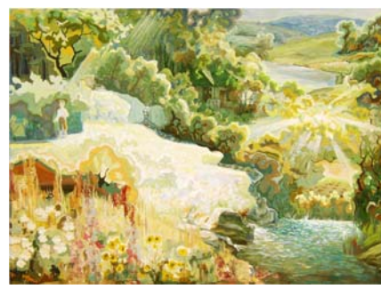
Fig.3 Copilărie/ 85 x 80 pânză, ulei 2010

După absolvirea studiilor superioare la Institutul Industrial de Arte Plastice, în prezent Academia de Arte și design, or. Harkov, Ucraina (1967) se afirmă ca un bun monumentalist atât în țară cât și peste hotare (Rusia, Ucraina). Putem menționa câteva lucrări valoroase în pictura parietală precum "Civilizație" (Sala Biosferei a Muzeului de Etnografie și Istorie Națională, Chișinău)(Fig.4), pictura "Tăria viței de vie" (Tiraspol, Muzeul Fabricii de Vinuri și Coneacuri "Kvint") (Fig.5), mozaic bizantin "Sala Voievozilor" (Școala "Meșterul Manole", Chișinău) (Fig.6), mozaic bizantin "Sfânta Treime" (Frontonul bisericii Sf. Nicolaie, or. Basarabasca) (Fig.7)[2].