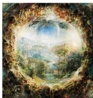
Fig.2 Oaza cosmică/ 100 x 100 pânză, ulei 2011