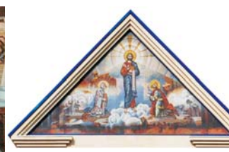
Fig.7 "Sfânta Treime", mozaic bizantin, frontonul bisericii Sf. Nicolaie, or. Basarabasca, R.Moldova