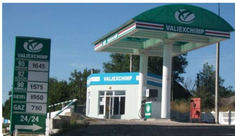
Figura 1. Stație PECO Valiexchimp

Prima întreprindere autohtonă, care s-a ocupat cu extragerea zăcămintelor de petrol și gaze naturale din R.M. este compania S.R.L. Valiexchimp Fig. 1 [2], preluată de la compania Redeco, din 2008.