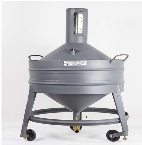
Figura 4. Măsură de volum etalon de ord. 2

Întocmirea rezultatelor verificării metrologice se efectuează conform următoarelor principii: