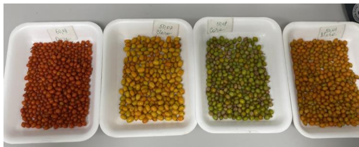
Рис. 1. Экспериментальные образцы облепихи

Количество ягод определяли методом подсчета в 100 г пробы в трех повторах. Массу ягод, соотношение мякоть/плод определяли весовым методом, путем взвешивания 100 ягод на электронных весах с погрешностью 0,001 г.