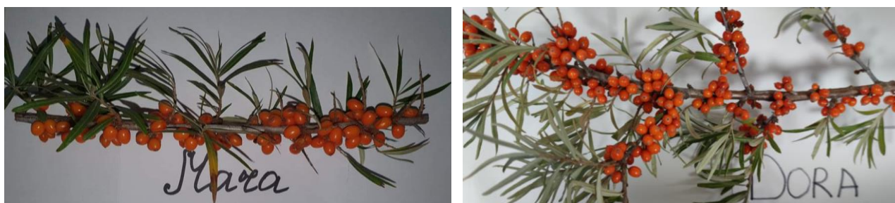
Рис. 3. Ягоды мелкоплодных сортов облепихи (урожай 2021г.)

Как показали исследования, диапазон варьирования массы 100 г ягод – 17,79-33,37 г. В соответствии с дифференциацией сортов ягод облепихи, сорта Mara и Dora относятся к мелкоплодным (с массой 100 г ягод до 25 г), сорта Cora и Clara - к сортам со средней массой (масса 100 г ягод 25-45 г).