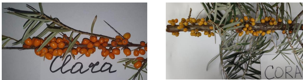
Рис. 4. Ягоды сортов облепихи со средней массой (урожай 2021г.)

В результате определения размерных величин были рассчитаны средний арифметический диаметр, средний геометрический диаметр, степень сферичности, площадь поверхности и объем ягод. В таблице 2 представлены геометрические размеры ягод облепихи