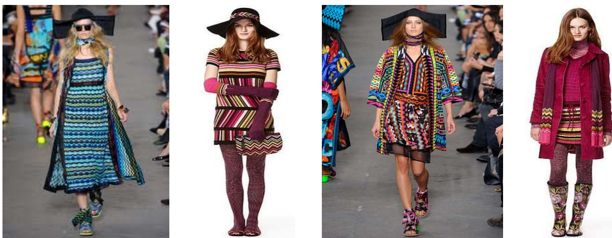
Fig. 1 Tendințe actuale ale elementelor de decor în produsele de tricot brandu Angele Missoni [1]

În industria de tricotaje, decorarea produselor utilizînd diversele elemente și metode de realizare a decorațiunilor au un rol semnificativ deoarece, anume prin decorarea acestora își îndeplinesc scopul inițial de existență ca produse tricotate, ca rezultat al tendințelor modei care an de an sînt diverse ca aspect și destinație. Facîndm o analiză comparativă a trei branduri de talie diferită pentru a realiza un studiu de cercetare. Studiînd revistele de specialitate se poate afirma că majoritatea brandurilor folosesc mijloacele de decorare prin tricotarea structurilor și siluetele nestandarde de o complexitate diversă celor clasice cunoscute. Dacă vorbim despre Angela Missoni tendințele actuale a produselor de tricotaje optează pentru diversitatea de culoare și amestecul ei, aplicații diverse și cusături decorative figura 1, folosirea franjurilor și imprimeurilor strălucitoare [1].