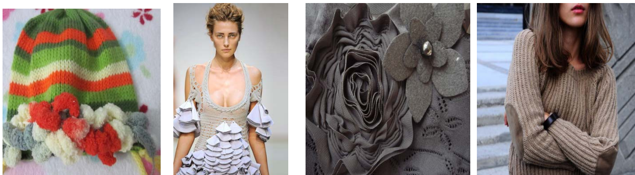
Fig.7 Elemente decorative obținute prin combinarea cu alte materiale [3]

În prezent se utilizează combinația produselor tricotate cu diferite materiale: tesături, netesute cât și materiale elastice. Designerii le utilizează pentru contrastul schimbului de stiluri, figura.