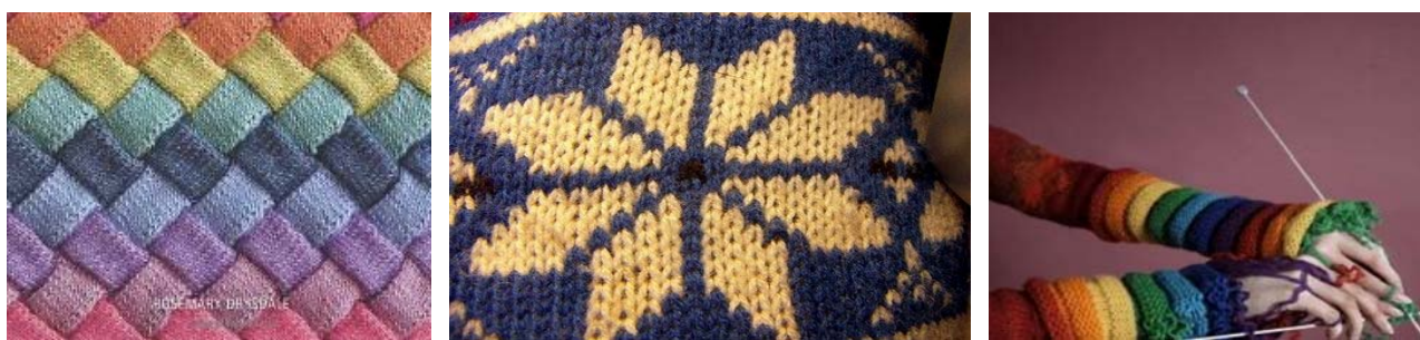
Fig. 8 Elemente decorative obținute prin desene de legatură [1]

Tot mai frecvent sînt utilizate desenele de culoare in vederea decorarii produselor de tricotate. Aceste culori vin sa schimbe plectiseala din garderobile noastre uzuale si a redeva un aspect cît mai fresh vestimentelor tricotate, figurile 8.