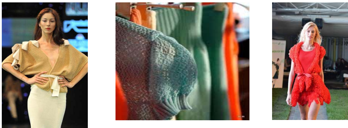
Fig. 2 Tendințe actuale ale elementelor de decor în produsele de tricot brandul Chinga Varga [2]