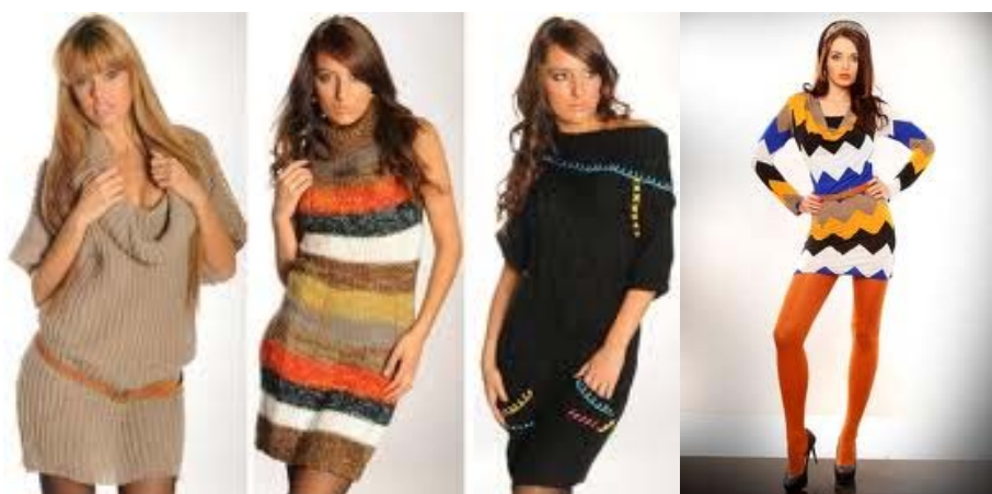
Fig. 3 Tendințe actuale ale elementelor de decor în produsele de tricot brandul Maxin [3]