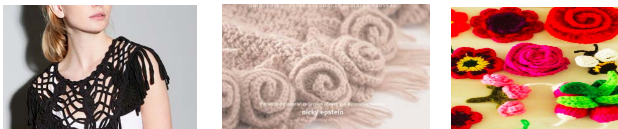
Fig. 6 Elemente decorative obținute prin metoda Macrame și Croșetare

Macrame. Este un mod de decorare al produselor din tricot prin care se realizează prin înnodare cu mâna ale caror margini se termină cu franjuri, figura 6. Se execută cu fire groase bine răsucite, speciale numite fire macramé [4]. Aceasta metoda de decorare este foarte actuală, realizată unicat cu numeroase posibilități al structurilor. Decorarea produselor cu macramé a fost mereu foarte des utilizată încă din epoca Renașterii. Această tehnică este un produs realizat manual și este unicat, cu numeroase posibilități al structurilor, foarte interesante, oferă confortul tuturor femeilor de achiziționa o haină realizată fără o a doua copie.