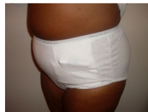
Chiloți cu buzunar