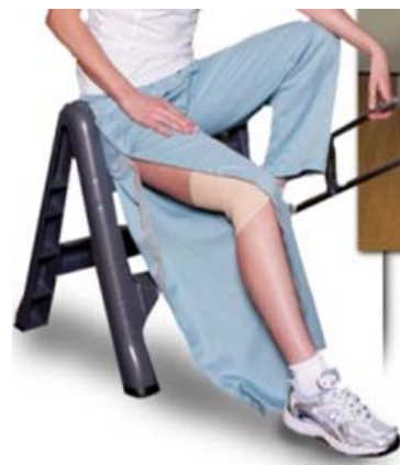
Pantaloni cu deschiderea laterală