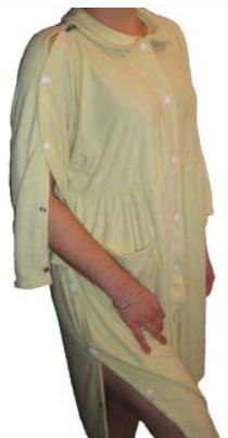
Halat cu deschiderea în regiunea umerilor, mînețelor și părților laterale