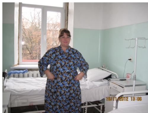
Fig. 1 Nivelul actual de asigurare cu produse vestimentare a persoanelor spitalizate

Înterpretări și propuneri în vederea asigurării cu produse de îmbrăcăminte pentru persoane cu nevoi speciale. În prezent atât spitalele cât și producătorii se confruntă cu problema asigurării cu produse special adaptate condițiilor de spital, și prezintă cereri de produse ce ar poseda: proprietăți antibacteriene, grad înalt de funcționalitate, confortabilitate și nu în ultim rînd aspect estetic plăcut, deoarece produsele aduse de pacienti nu corespund nici unui criteriu din cele enumerate. În vederea soluționării [2] problemei de asigurare cu produse speciale a persoanelor cu nevoi speciale, ca prima etapă s-a propus elaborarea schemei de clasificare a îmbrăcămintei speciale pentru persoane spitalizate.