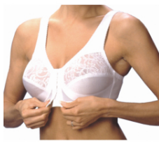
Sutien cu deschidere din față