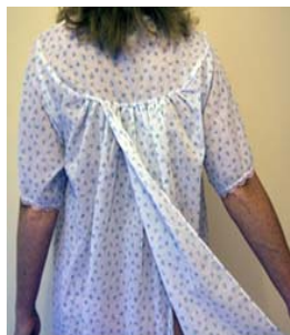
Cămașa de noapte cu deschiderea laterală

➤ maiouri - este un articol de lenjerie (cu sau fără mâneci), care se îmbracă direct pe corp, acoperind partea superioară a acestuia.