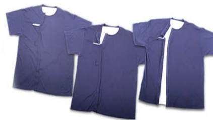
Maiou cu deschiderea în regiunea bustului