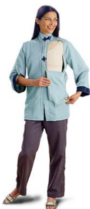
Tricou cu deschiderea în regiunea bustului

• este prezentă o suprapunere pentru a păstra demnitatea atunci când se deplasează este purtată în perioada post-chirurgicală de recuperare.