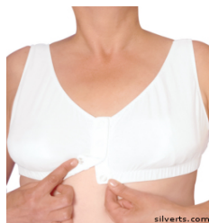
Sutien cu deschidere din față

➤ Chiloții - sunt articolele de vestimentație care acoperă zona pubiană și fesele celor ce îi poartă. Protejează organele genitale de contactul direct cu îmbrăcăminte exterioră care prezintă senzații asprime, deasemeni și rol în păstrarea igienei intime.