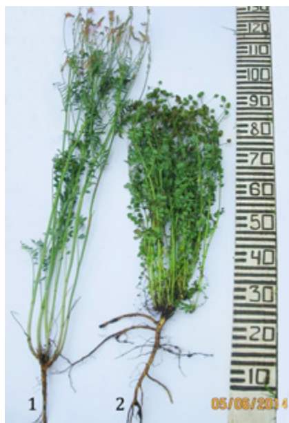
Рисунок 2. Конституционные особенности фенотипов эспарцета и черноголовника

Главным конституционным преимуществом черноголовника (2) над эспарцетом (1) является более высокая корнеобеспеченность надземной вегетативной массы ( K_{\text{вм}} ). У черноголовника она в среднестатистическом варианте составляла 1,78 ( K_{\text{вм}} = 642 / 361 ; 642 г – корневая масса растения, 361 – травяная масса); у эспарцета – 1,48 ( K_{\text{вм}} = 536 / 362 ), т. е. уступает на 20,3%.