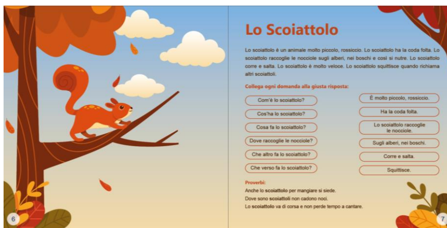
Figura 1. Exemplu de soluționare estetică a paginilor de interior pentru carte

Textul este amplasat în secțiuni: descrierea personajului/subiectului, joc interactiv-cognitiv, întrebare-răspuns și proverbe/curiozități (fig.1). Imaginile sunt bidimensionale, ușor de reprodus în culori vibrante pentru a captura atenția și memorabilitatea micului cititor. Tipul de copertă este de tip 01, flexibil, cu clame, din considerentul volumului mic al conținutului – 28 pagini.