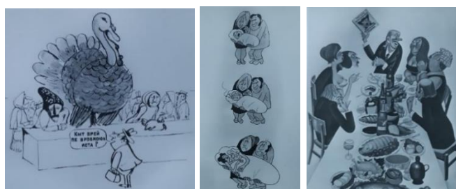
Figura 4. Foi grafice prezentate la Expoziția republicană de pancarde politice și grafică satirică [1, 10]