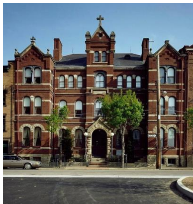
Figura 6. Hotel “Priory” din Pittsburgh, SUA [15]