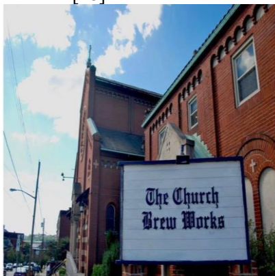
Figura 9. „The Church Brew Works” din Pittsburgh, SUA [18]

clădirea a fost transformată într-o fabrică de bere. Întregul proiect de reamenajare a fost finanțat privat de investitori regionali și proprietari locali din Pittsburgh. Mai mult de 95% dintre aceste fonduri au fost direcționate către dezvoltare, în timp ce restul au fost folosite pentru reducerea vopselei cu azbest și plumb și îmbunătățirea utilităților publice. La moment au putut fi folosite 10.000 de metri pătrați din biserica însăși, 4.500 de metri pătrați din rectorii, și 2.000 de metri pătrați din școala adiacentă [18].