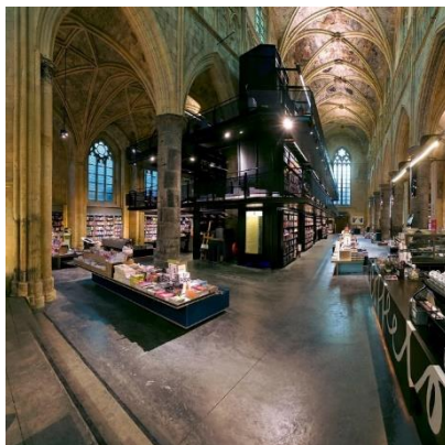
Figura 10. Librăria Boekhandel Dominicanen [20]

➤ În librării: Librăria Boekhandel Dominicanen (Polare Maastricht) Olanda [fig.10]. În 2008, librăria Boekhandel Dominicanen (Polare Maastricht) a fost aleasă drept cea mai frumoasă librărie din lume de ziarul britanic The Guardian , iar de atunci apare an de an în fruntea listelor celor mai apreciate librării de cititori. Și-a deschis ușile în 2007 la Maastricht. Spațiul ales este cu adevărat unic, deoarece este o veche biserică gotică dominicană construită în 1294. Din fericire, și în ciuda faptului că a fost abandonată de mai bine de două sute de ani, biserica nu a devenit o ruină, deși abia în 2006, după ce a servit diferitor utilizări, inclusiv depozitul de biciclete, clădirea a fost restaurată și a devenit, în cele din urmă, o librărie originală. Firma olandeză de arhitectură și design interior MERKX + GIROD s-a ocupat de renovarea vechii biserici, transformare care i-a adus în 2007 Premiul Lenvelt pentru arhitectură interioară. Interiorul este realizat într-un stil minimalist, dar cu păstrarea detaliilor originale. Tavanele boltite