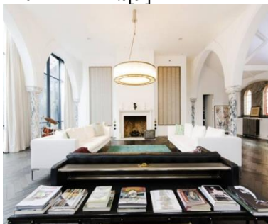
Figura 2. Casă de locuit din orașului Kenmont Gardens, North Kensington, Londra, Anglia [9]

➤ Restaurante: A doua cea mai populară transformare este transformarea unei biserici într-un restaurant. Ex: exemplu restaurantul Old Library din suburbia Sydney. Biserica în care se află a fost construită în anul 1908, iar din anii 70 până de curând în ea a existat o bibliotecă (de unde și numele restaurantului). Dar această ultimă încarnare este cea care a făcut-o cu adevărat drag localnicilor. Spațiul minunat, contemporan, plin de lumină este parțial restaurant, parțial bar, cu o mulțime de semne ale trecutului livresc al clădirii [fig.3] [10].