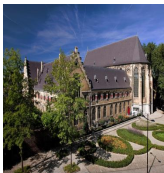
Figura 8. Hotel Kruisherhotel Maastricht (Olanda) [17]

➤ În berării: Pub-ul Church Brew Works din Pittsburgh [fig.9] se află în fosta biserică Sf. Ioan Botezătorul, care a început să fie construită în anul 1902. Parohia ei a fost reorganizată în 1993, iar în 1996