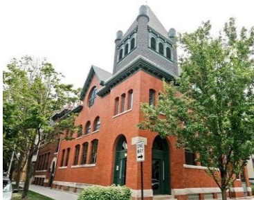
Figura 1. Casă de locuit din Chicago SUA [8]

și suprafețe din beton. Toate cele patru dormitoare somptuoase includ baie proprie, trei dintre ele având și câte un minunat dulap walk-in. Și aceasta încă se vinde contra sumei de 10 milioane £[9].