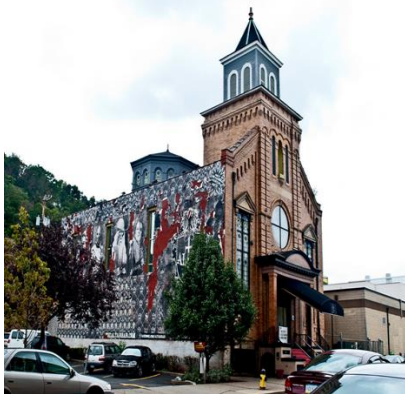
Figura 5. „Altar Bar” din Pittsburgh, SUA [14]

Acum, clădirea este pe cale să devină biserică din nou. Orchard Hill Church, o mare congregație non-confesională cu sediul în suburbia Franklin Park, a achiziționat fostul Altar Bar la sfârșitul anului 2016 pentru 800.000 de dolari, iar acum lucrează cu arhitecți și antreprenori pentru a planifica o restaurare [13].