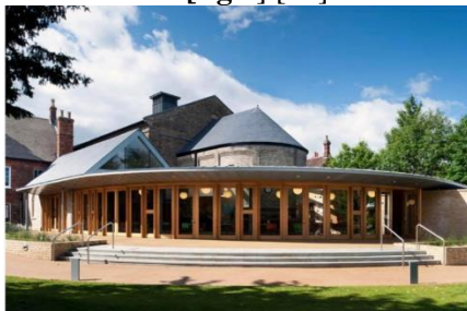
Figura 4. Teatrul Quarry de la St Luke's [11]

➤ Teatre: Datorită acusticii și spațiului larg, unele biserici se transformă în teatre. Ca ex: Vechea biserică din Bedford, care s-a închis în 2008, a avut norocul să devină teatru. Teatrul Quarry de la St Luke's a