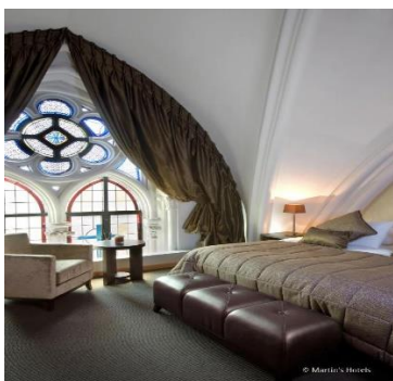
Figura 7. Hotel“ Martin Patershof din Mechelen, Belgia”[16]

Sau Kruisherhotel Maastricht . Datând din secolul al XV-lea, fosta mănăstire Kruisher și biserica gotică alăturată au fost transformate într-un hotel de design spectaculos de cinci stele, situat în inima centrului istoric al orașului Maastricht. Membru al Design Hotels și distins cu Dutch Hotel Award 2017, Kruisherhotel Maastricht combină arhitectura care provoacă gândirea cu caracteristici originale în cele 60 de camere ultramoderne, fiecare cu propriile particularități și detalii individuale[17].