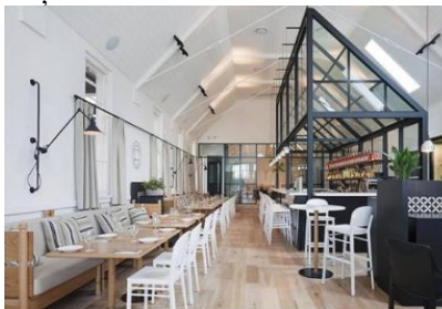
Figura 3. Restaurantul “Old Library”, din suburbia Sydney, Australia [10]

➤ Restaurante: A doua cea mai populară transformare este transformarea unei biserici într-un restaurant. Ex: exemplu restaurantul Old Library din suburbia Sydney. Biserica în care se află a fost construită în anul 1908, iar din anii 70 până de curând în ea a existat o bibliotecă (de unde și numele restaurantului). Dar această ultimă încarnare este cea care a făcut-o cu adevărat drag localnicilor. Spațiul minunat, contemporan, plin de lumină este parțial restaurant, parțial bar, cu o mulțime de semne ale trecutului livresc al clădirii [fig.3] [10].