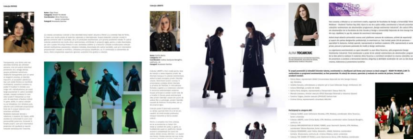
Figura 3: Cele mai bune colecții vestimentare din cadrul Festivalului Internațional „Students’ Fashion Day” selectate de Casa editorială „DAS”, 2022

Fie că este vorba despre design grafic, fotografie, film, modă sau sculptură, concursurile oferă studenților un teren de joacă autentic cu posibilitatea de a-și demonstra abilitățile tehnice și creativitatea. Lucrările premiate în astfel de competiții devin repere în portofoliul unui student, adăugând valoare substanțială în ochii potențialilor angajatori sau colaboratori din industrie.