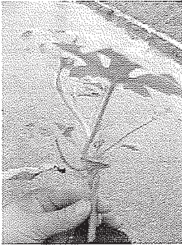
Fig.1. Răsad altoit prin despicătură înainte de plantare

În varianta martorului se observă un raport mai mic între masa aeriană și cea radiculară (2,45), ce denotă activitatea mai joasă a rădăcinii în comparație cu acest raport la plantele altoite (2,9). Sistemul radicular al portaltoiului are o capacitate mai puternică de transportare a substanțelor minerale și a apei. Aceasta a favorizat dezvoltarea unei mase aeriene mai mari în comparație cu martorul, (fig. 1,2)