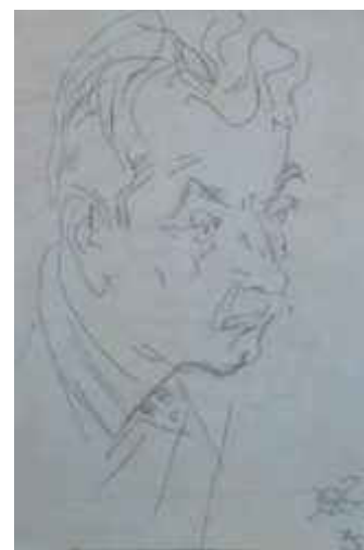
Fig. 6. Șarjă la adresa scriitorului G. Gheorghiu

În arhiva Muzeului Național de Literatură „Mihail Kogălniceanu” din Chișinău se găsește o șarjă a prozatorului și istoricului literar Gheorghe Gheorghiu realizată de plasticianul Filimon Hămuraru în anul 1975 (fig. 6). Acest chip imortalizat denotă consistența vieții, totodată este convingător și sugestiv întrucât artistul plastic a perceput adâncimea psihologică a scriitorului, care ne poate spune multe despre personalitatea lui. Iar prin intermediul a doar câteva linii subțiri se reușește punerea în valoare a fizionomiei și privirii. Deci, Filimon Hămuraru găsește un tip de structură proprie care îi definește specificul artistic în șarjă.