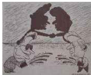
Fig. 8. Fără cuvinte [20, p. 3]