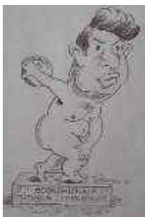
Fig. 7. Economistul tuturor timpurilor [19, p. 2]