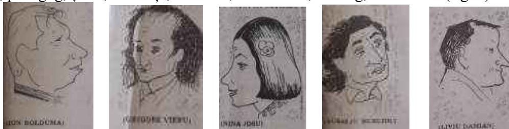
Fig. 4. Șarje prietenești [16, p. 3]