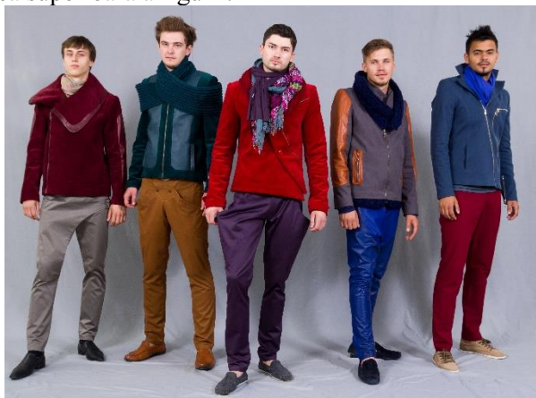
Figura 3. Imaginea colecției vestimentare elaborate

Elementele decorative reprezintă un alt aspect extrem de important – atât în organizarea compoziției costumului, cât și în obținerea expresiei estetice și armonioase a colecției. Decorul poate avea diferite aspecte și calități. Astfel, expresia decorativă primară în colecția elaborată este obținută cu ajutorul furniturii: nasturi, fermoare, copci, cataramă . Ținând cont de unele cerințe, cum ar fi confortul la purtare și funcționalitatea produsului, precum și de compatibilitatea decorului cu materialele de bază, – s-a optat pentru amplasarea elementelor decorative pe diferite zone care nu doar accentuează, dar și scot în evidență particularitățile definitorii ale colecției. De altfel, și decorul realizat cu ajutorul tehnicii tricotării manuale completează armonios ansamblul colecției. Grație detaliilor tricotate centrul de interes este amplasat, la majoritatea produselor, în partea superioară a figurii.