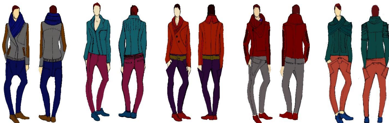
Figura 1. Schițe ale modelelor din colecția elaborată ( vedere față, spate )

oamenilor din mediul urban. Această eclectică se potrivește oricărei ocazii, atâta timp cât se acceptă o atitudine nonșalantă.