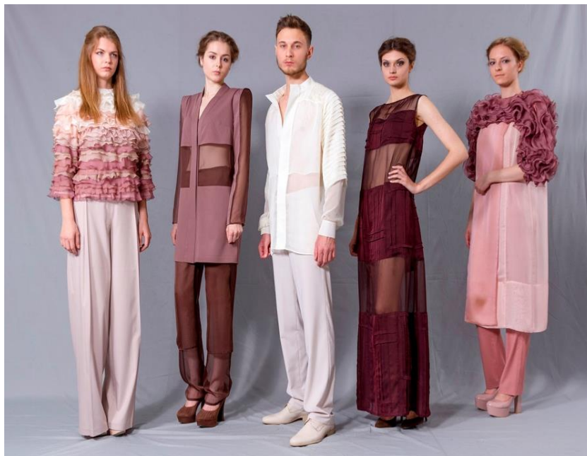
Figura 3. Colecția vestimentară elaborată

Decorul colecției, bazat pe principiul ritmului, constă din sisteme de volane din șifon subțire și pliuri, amplasate paralel sau perpendicular. Rochia modelului 5 (fig. 2) este decorată în partea superioară cu un sistem de volane, de culoare mov, care alcătuiesc plastica liniară curbă a structurii compoziționale a colecției, oferă produsului caracter vibrant, îndrăzneț și rafinat. Ritmul volanelor creează dinamică, raportată la verticalele și orizontalele drepte.