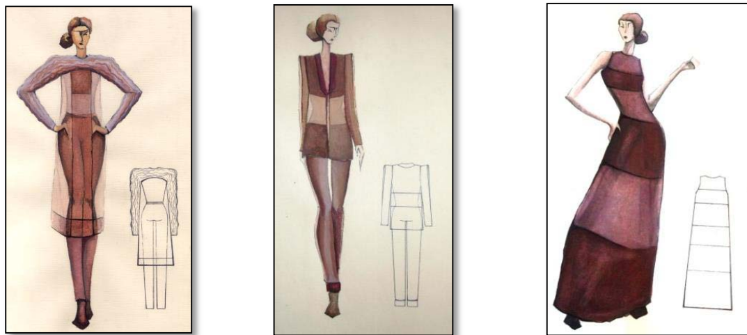
Figura 1. Schițe ale modelelor din colecția elaborată (modelele 1-3)

Conform esteticii neoplasticiste, omul se află într-o continuă căutare de sine în lumea înconjurătoare, în determinarea aceluși echilibru, existența căruia nu poate fi negată și, mai mult ca atât, acest echilibru trebuie atins. Fiind într-un zbucium sentimental permanent, omul sparge stereotipuri, încalcă reguli, se cufundă în emoție și sentiment pentru ca ulterior, depășind lupta contrariilor lăuntrice și cunoscând limitele admisibilului, să ajungă la înțelegerea propriului eu și a locului său în lume. Or, individul este verticala, iar lumea ce-l înconjoară reprezintă orizontala. Avântul spiritual, elanul, visul (trăsături de natură romantică) – sugerează ascensiunea verticală, atunci când orizontala este reprezentată de rigorile clasice, fără imperative, stricte și decente, cele care stopează haosul și absurdul. Armonia acestor două componente asigură echilibrul existențial, dezvăluie logica frumuseții și esența formei, face personalitatea să existe și să respire elegantă.