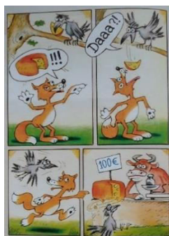
Fig. 4. Margareta Chițcații. Daaa?! Salonul Național de artă satirică, Galeria de artă „Nicolae Mantu” Galați 2010