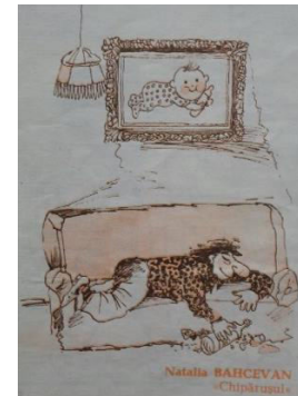
Fig. 3. Natalia Bahecvan. Fără cuvinte. Ediția comună a revistelor de satiră și umor din Chișinău și Galați „Chipărușul” nr. 2-3 și „Cucuveaua” nr. 1 din 1993