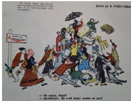
Fig. 2. Valentina Rusu-Ciobanu. Ce cauți, bade? Revista de satiră și umor „Chipăruș” nr. 7, aprilie 1958