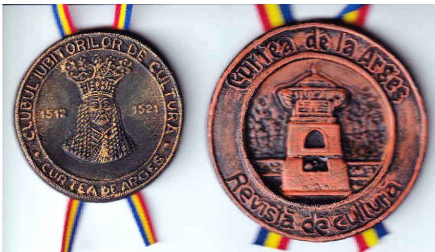
Fig. 1.1. Medalii de lut.