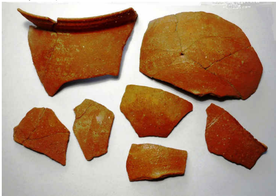
Fig. 1.4. Cioburi de pe Dealul Olarilor.