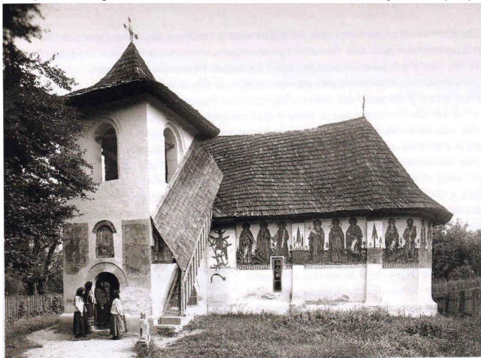
Fig. 1.5. Biserica Olari.

din secolele XIII-XIV s-a trecut la o ceramică nouă: ulcioare cu bumbi reliefați, vase zoomorfe, cărămizi de construcție. Cu ultimele se vor zidi și marile lăcașuri bisericesti și de cultură din Argeș. Se mai lucrau și frize și ciubuce pentru decorarea interioarelor, chenare la ferestre și uși,