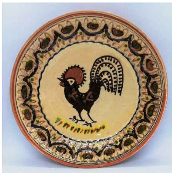
Fig. 1.3. Cocoșul de Horezu.

Din străvechimea Cucutenilor – și mai vechi fiind civilizațiile Turdașului și Hamangiei – revin în vremea noastră, la Horezu. Strălucitor, vestit, controversat. Tradițional, ceramica era utilitară, dar decorată cu mare meșteșug, cu personalitate, de la culori („roșul și galbenul de Horezu”) la motive (spiralele sunt specifice, iar „cocoșul de Horezu” este simbol și emblema (fig.