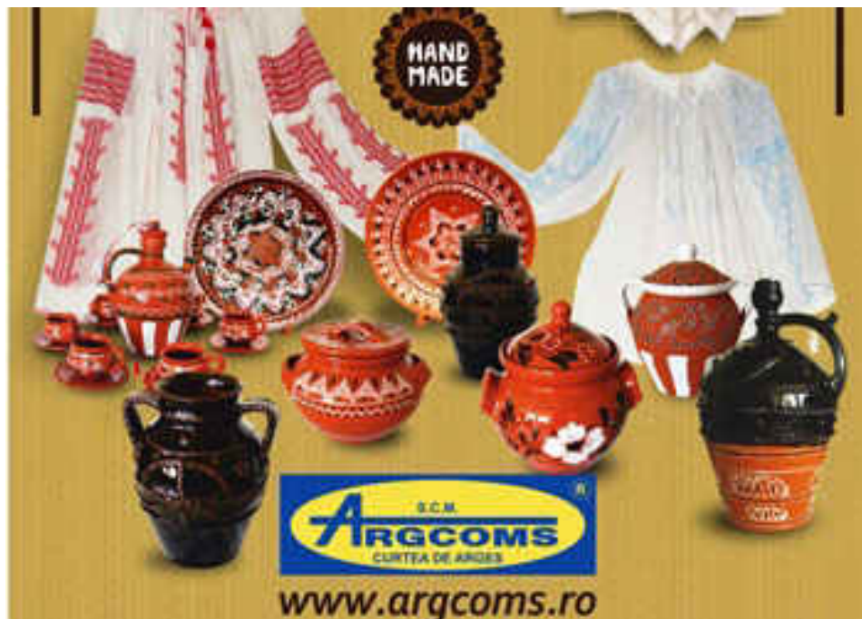
Fig. 1.6. Produse ARGCOMS.

pare a se salva la oraș, instituțional, pe lângă case de cultură, școli, unități turistice, muzee, ateliere cu preocupări comerciale. În privința muzicii și dansurilor populare, se constată o veritabilă resurrecție a interesului și la nivelul televiziunilor, iar ia populară a trecut de mult granițele, devenind un veritabil obiect de modă, un „brand” românesc. Este un subiect important și delicat în ce măsură preluarea organizată a folclorului păstrează autenticitatea, tradiția, valoarea, dar, la prima vedere, importantă este continuitatea.