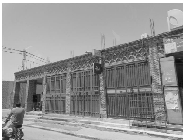
Figura 2. Construcție aparent nefinalizată din Tunisia - a se vedea „mustășile de armătură” de la partea superioară, în contrast cu finisajele exterioare.

(3) Prezența așezărilor informale este ilustrată în Figura 3 de o imagine de la periferia orașului Casablanca din Maroc. Așezările informale sunt „formațiuni rezidențiale dezvoltate de regulă la marginea localităților urbane sau rurale, în care ocuparea terenurilor are un statut ilegal sau legal, iar construcțiile sunt neautorizate sau respectă parțial autorizațiile obținute, cărora le lipsește accesul la infrastructura tehnico-edilitară de bază, condiții adecvate de locuire etc., ce pun în pericol siguranța și starea de sănătate a populației rezidente” [[7]]. Uneori acestea au o mare întindere, cum se întâmplă în cazul orașului Oran din Algeria, unde acestea sunt caracterizate nu numai de condiții precare de locuire, ci și de transport, pentru că transportul public nu poate fi extins, câtă vreme zona nu există în mod oficial. După un timp, astfel de așezări intră în legalitate, însă condițiile precare de locuire se mențin.