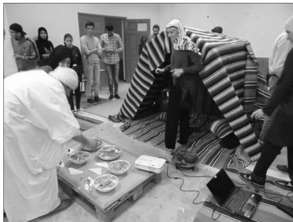
Figura 4. Reconstituire a habitatului de tip „ksar” la Universitatea din Oran.

(5) Urbanismul controlat din orașele mari urmează, în general, principiile urbanismului francez, derogările fiind imposibile. Dezvoltarea urbană se realizează pe baza unor planuri de urbanism aprobate de organele competente, iar în Figura 5, reprezentând o imagine din orașul Marrakesh din Maroc, se poate vedea un panou de afișaj în care este prezentat proiectul ce urmează a fi implementat în locul respectiv. În acest oraș se respectă strict reglementările urbanistice, inclusiv păstrarea cromaticii (cărămiziu) de către noile construcții.