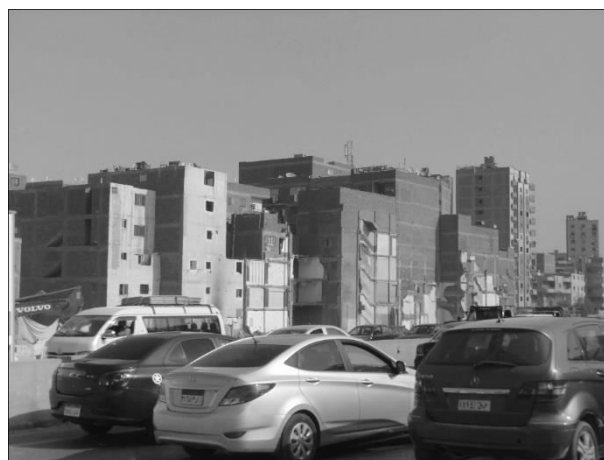
Figura 6. Demolarea construcțiilor aflate de-a lungul unui bulevard din Cairo (Egipt) pentru extinderea sa.