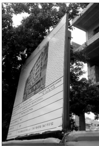
Figura 5. Panou de afișaj pentru un nou proiect din orașul Marrakesh din Maroc. Sursa imaginii: Alexandru-Ionuț Petrișor, 2017.

(6) În acest peisaj, Egiptul se poziționează ca excepție, inclusiv prin operațiuni urbane ample, cum ar fi demolarea unei zone ample din Cairo pentru a lărgi arterele de transport (Figura 6), în paralel cu strămutarea populației din zonele demolate în Noua Capitală Administrativă. În general, analiza întreprinsă arată că urbanismul derogatoriu reprezintă o caracteristică comună a țărilor analizate, cu cauze diverse.