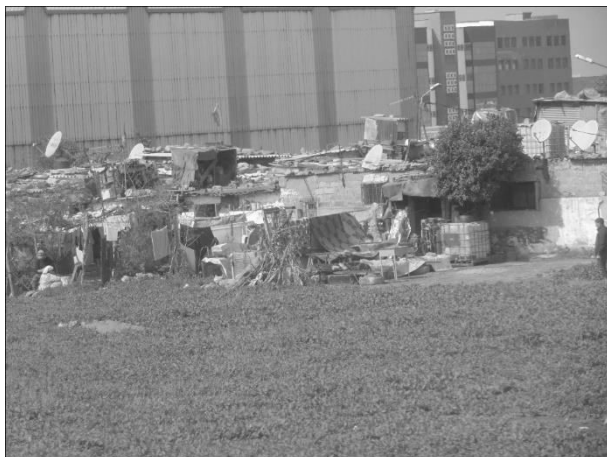
Figura 3. Așezare informală la periferia orașului Casablanca din Maroc.

(4) Habitatul tradițional de tip „ksar” (plural: „ksour”) reprezintă un subiect pentru literatura de specialitate [[8]], dar și un factor de promovare a turismului. Figura 4 prezintă o reconstituire a acestui habitat de către studenții Universității de Știință și Tehnologie Mohamed Boudiaf din Oran, Algeria în cadrul unui curs.