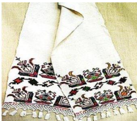
Figura 1. Forma inițială a ornamentului

Uniformitatea ornamentelor florale, răspândite pe tot cuprinsul țării, se datorează apariției culegerilor de motive încă de la sfârșitul secolului al XIX-lea. În general, în ornamentica tradițională moldovenească ideea de floare a fost exprimată, printr-o corolă conturată în linii drepte, motiv pentru care identificarea ei este foarte dificilă.