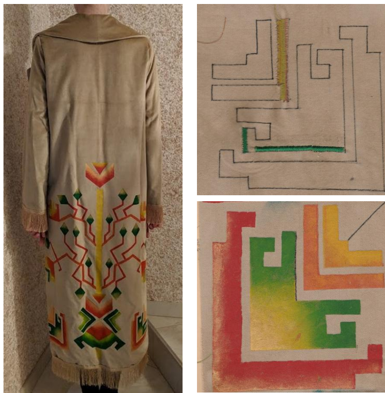
Figura 3. Aspectul exterior al modelului realizat și mostre de decor

Tradiția nu se identifică neapărat cu trecutul, ci este vorba de o selecție a bunurilor acestei moșteniri, aplicând amprenta particulară. Valorile culturale, cele care reprezintă o epocă și un mod de a înțelege lumea, dobândesc, prin forța lor o anumită identitate și expresivitate, devenind repere pentru conștiința unei societăți. Ele sunt mereu reinterpretate, din noi perspective, fiind astfel readuse la viață și actualitate.