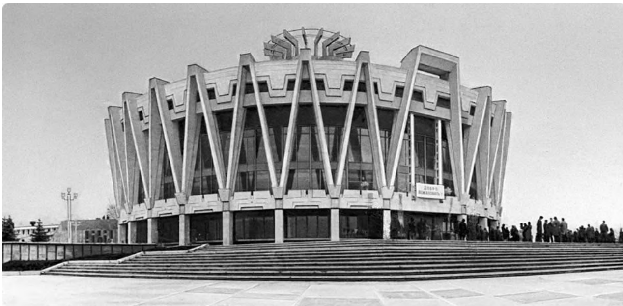
Рис. 2. Здание кишиневского цирка 6

административная часть расположена в стилобате, который находится ниже по рельефу. 4 Интересным композиционным и инженерным решением обладал цирк на 2300 мест в Новосибирске. Здание цирка является круглым в плане. Амфитеатр и манеж смещен относительно центра здания. В результате чего форма крыши изменилась на гиперболический параболоид. 5 Используя данный опыт, кишиневские авторы разработали наилучшее решение в планировочном и технологических аспектах, чтобы сделать возможным постановку на арене технически сложных театрализованных цирковых представлений, а также организации соответствующих условий для зрителей и качественного размещения артистов и животных.