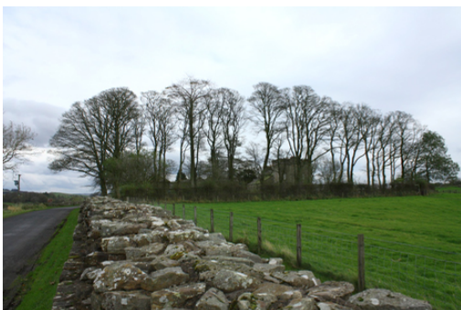
Porțiune de zidul Hadrian [2].

După cucerirea Daciei la 106d.Chr. Imperiul Roman a folosit cohorte de daci (unități militare de 500-1000 soldați) pe tot cuprinsul Imperiului, inclusiv în Marea Britanie, descoperirile arheologice confirmând acest fapt. Aceasta începe la puțin timp după cucerirea Daciei de către Imperiul Roman, în anul 122 d.Chr., când împăratul roman Hadrian a ordonat construirea unui zid la marginea britanică a imperiului. Zidul se suprapune aproximativ pe granița de azi dintre Anglia și Scoția. Motivul real al unei