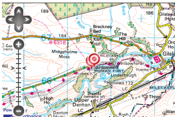
Porțiune a zidului Hadrian din localitatea Birdoswald [3].

Conform istoriografilor romani posesiunile Imperiului în spațiul Carpato-balcano-pontic era divizate în două părți: Dacia Superioară,