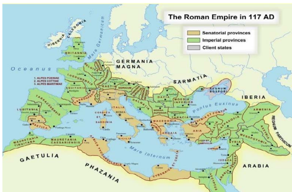
Imperiul Roman în perioada maximei sale extensiuni.

Imperiul Roman a fost cel mai mare și cel mai durabil imperiu al tuturor timpurilor (a existat cca 700 de ani). Au fost imperii mai mari (de ex. al lui Alexandru Macedon, al lui Chinghis Han, dar nu au fost durabile). El a crescut atât prin puterea armelor, copleșind noi teritorii, cât și prin civilizația, pe care au promovat-o în noile