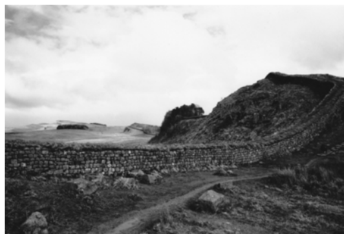
Porțiune de zidul Hadrian. Foto. A. Pichler-Tennenberg (2012)