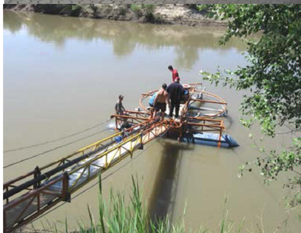
Fig. 10 MHCE elaborate la UTM

Unul din motivele de bază de reducere a eficienței producerii energiei electrice de MHCE cu generatoare electrice de construcție clasică a fost și este prezența multiplicatorului dintre turbina de apă și generatorul electric. Viteza unghiulară a acestor turbine hidraulice este redusă. Petru a exclude multiplicatorul dintre turbină și generatorul electric pot fi folosite generatoare electrice de turaj mică.