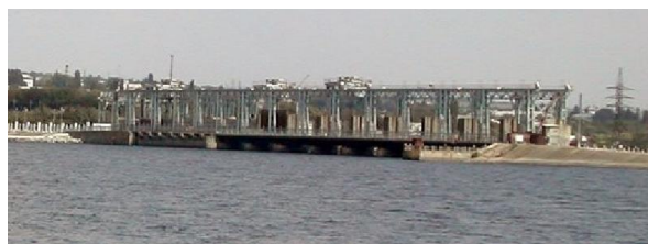
Fig. 6 CHE Dubăsari

Actualmente, în Republica Moldova energia hidroelectrică este produsă de două hidrocentrale: CHE Dubăsari (fig. 6) cu o capacitate de 48 MW și CHE Stâncă-Costești cu o capacitate de 16 MW.