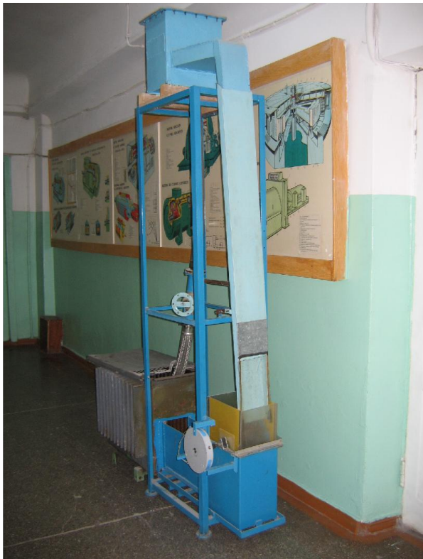
Fig. 13 Mostră experimentală de MHCE și generatoare axiale

În baza calculului realizat a generatoarelor-moștre axiale (cu puterea 0,3 – 5 kW) cu magneți permanenți, s-a demonstrat că randamentul instalației crește datorită excluderii multiplicatorului și a pierderilor electrice din înfășurarea de excitație.