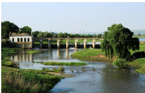
Fig. 4 Minihidrocentrala de la Căzănești

În anul 1954 a fost dată în exploatare MHCE cu puterea 150 kW construită la Căzănești (fig 4). Energia electrică era folosită de consumatori din mai multe comune din jur, însă aceasta nu a funcționat mult timp.