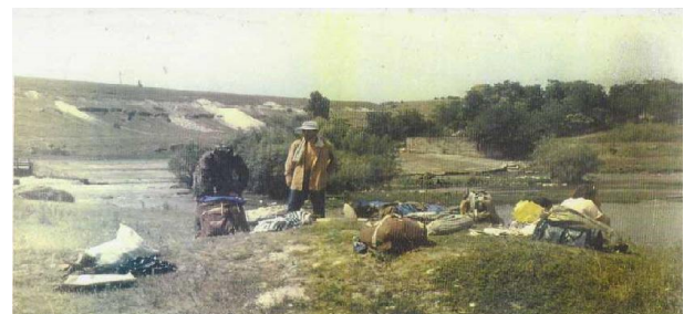
Fig. 3 Rămășițele microhidrocentralei Cubolta

Pe râul Cubolta, în comuna Cubolta, a fost construită o microhidrocentrală (fig. 3) care a funcționat până în anii 80 ai secolului trecut.