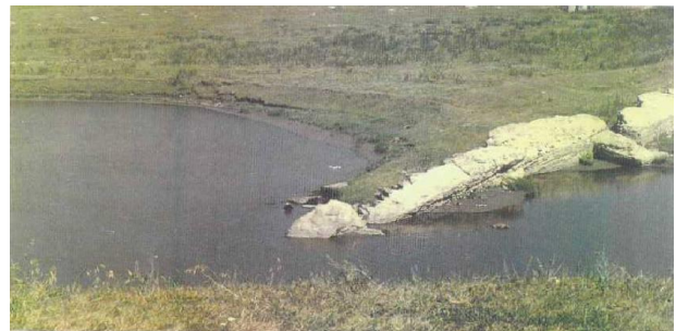
Fig. 2 Rămășițele minihidrocentralei Beloci azi

După al doilea război mondial (în anii 1948 – 1949) s-au restabilit pe afluenții Nistrului Camenca și Beloci (fig 2) (la Vadul Turcului) două MHCE, care au funcționat anterior: una avea puterea instalată de 57kW și H = 9\text{m} ; a doua avea puterea instalată de 32 kW și H = 7\text{m} . De la aceste MHCE se alimentau consumatorii aflați în raza de până la 5 – 7 km.