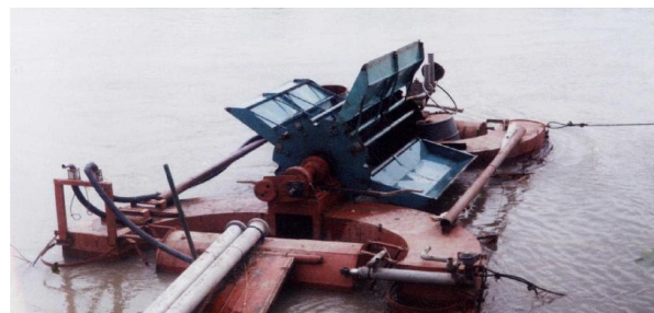
Fig. 9 Instalație plutitoare hidroenergetică pe r.Pрут (Stoianești, r.Cantemir) pentru pomparea apei în lac.

Pentru a soluționa problema energiei electrice în plină concordanță cu problemele ecologice, în fața specialiștilor, savanților-ingineri și ecologiști a fost pusă problema colaborării. Din cauza dificultăților provocate de microcentralelor cu baraje nu trebuie de renunțat la construcția acestora. Este necesar de a căuta noi căi de a folosi energia prezentă în scurgerile de apă, fără a dăuna mediului înconjurător figura 9.