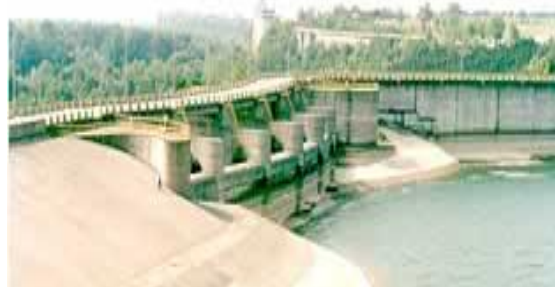
Fig. 7 CHE Stâncă-Costești

În anul 2001 la CHE Stâncă-Costești (fig 7) s-au produs 64.103 MWh energie electrică sau 6,1 % din producerea republicană de energie electrică.