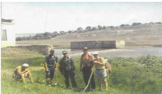
Fig. 1 Minihidrocentrala Ciuhur azi

Pe teritoriul Moldovei din stânga Prutului și dreapta Nistrului a fost folosită cu succes energia potențială și cinetică a apei râurilor, căderilor naturale și artificiale, fiind folosite în instalațiile de prelucrare a producției și pentru irigație locală. Morile de apă erau executate de meșteri locali sau importate.