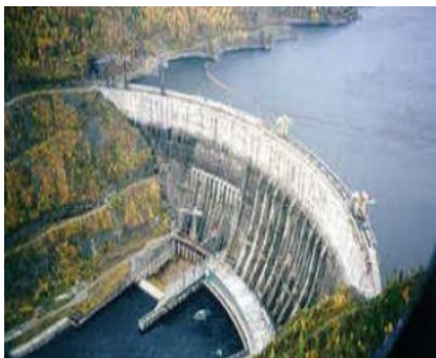
Fig. 8 Nodul hidroenergetic Sochireni-Naslavcea

În 1986, la Novodnestrovsk, regiunea Sokiryanskaya din Ucraina, a început să funcționeze a doua stație hidroelectrică. Pentru umplerea rezervorului din Novodnestrovsk, mai jos de hidrocentrala electrică, în satul Naslavcea, raionul Ocnița, Republica Moldova, a fost construit un baraj de reținere a apei, după care s-a format un alt rezervor pentru pomparea apei în rezervorul superior al hidrocentralei electrice (fig. 8).