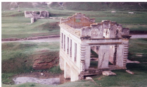
Fig. 5 Minihidrocentrală din comuna Piatra

Aceeași situație se observă și la MHCE din comuna Piatra/Jeloboc – Furceni (fig. 5), unde erau instalate 2 hidroagregate a câte 90 kW putere fiecare. Barajul în mare parte și clădirea parțial sunt distruse.