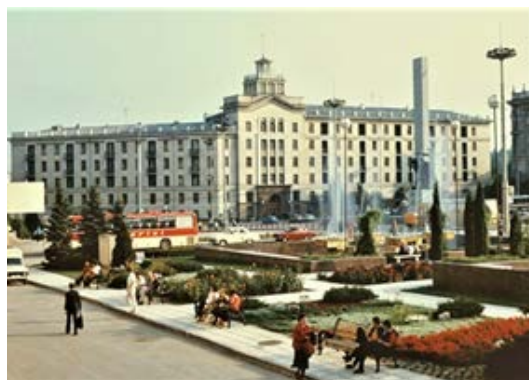
Figura 3. Vederea din anii '80.

https://locals.md/tag/oldchisinau/page/2/ , accesat 20.08.2018.