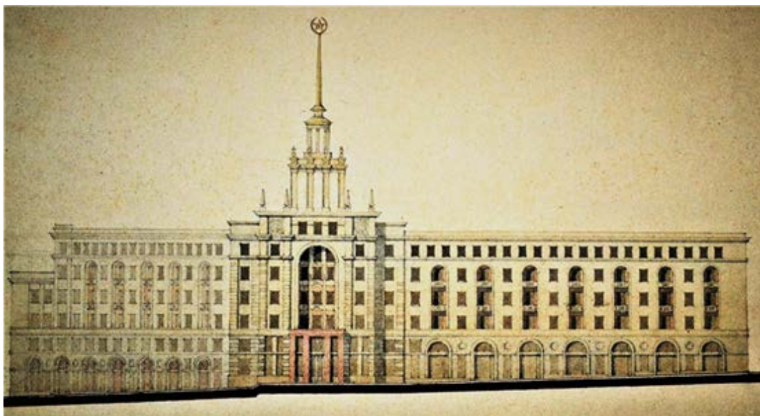
Figura 1. Fațada principală, varianta 1, anul 1953.